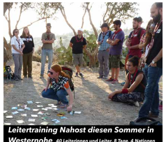
Leitertraining Nahost diesen Sommer in Westernohe 40 Leiterinnen und Leiter, 8 Tage, 4 Nationen