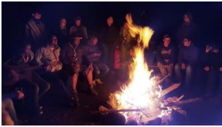
Foto-Impressionen vom Internationalen Dorf PiW 2016